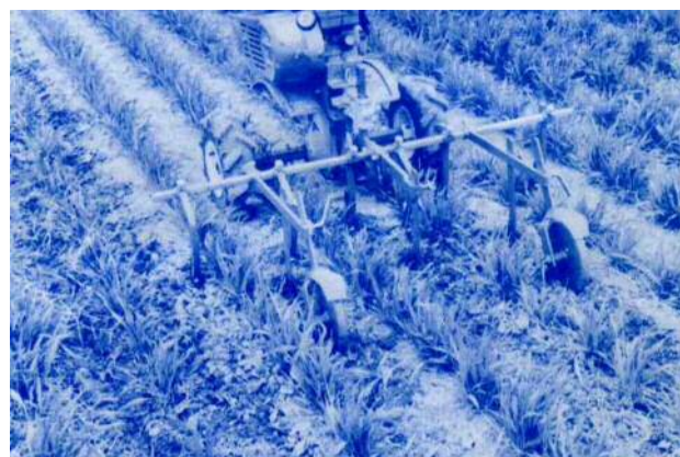
5 畦の場合 25 cm が好適