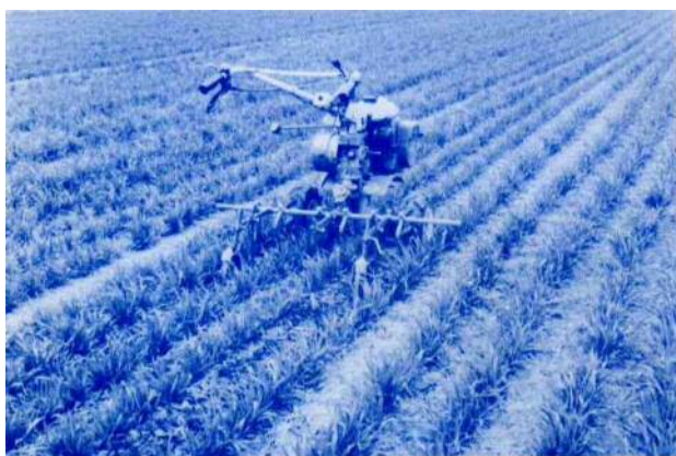
3 畦の場合畦幅 30 cm が好適