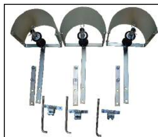
テープシーダ装置 (写真は3畦用)