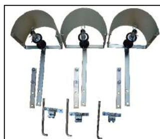
テープシーダ装置