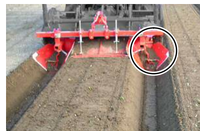
写真はサイド成形板付ソリセットを 取付けた PH-A-14