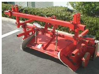
写真は播種機取付キットを取付けた PH-A-14