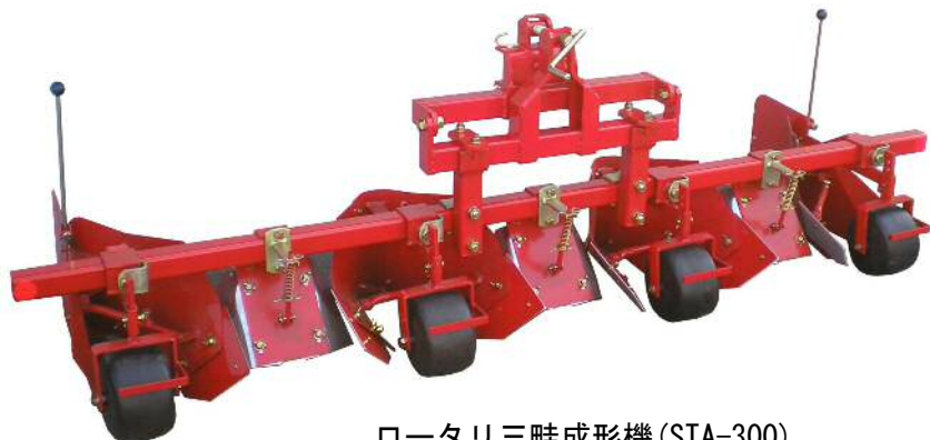
ロータリ三畦成形機 (STA-300)