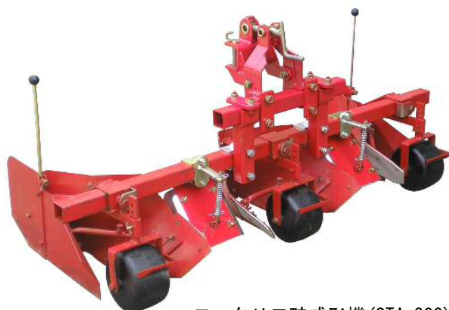
ロータリ二畦成形機 (STA-200)