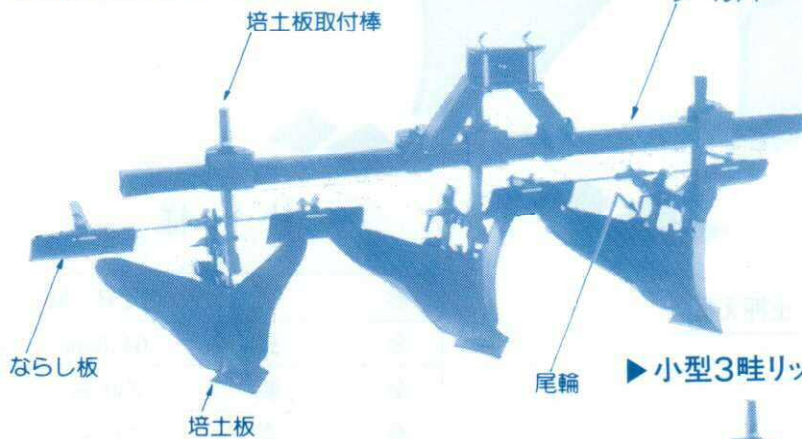
▶小型3畦リッジャー4形